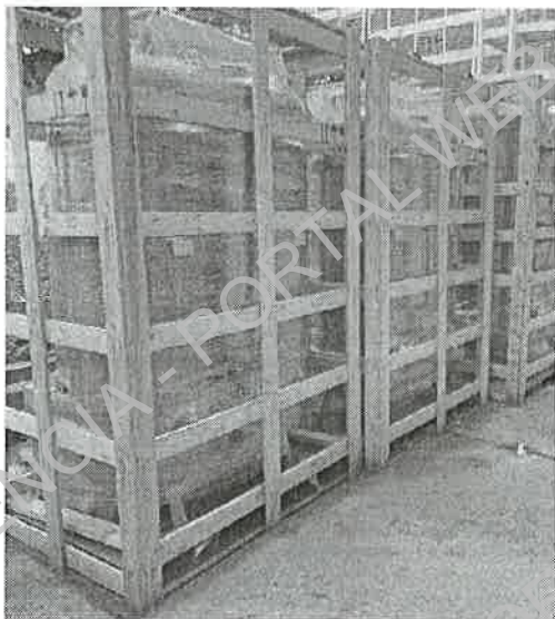
Imagen V. Equipos verificados en inventario, en fecha 12/09/23.