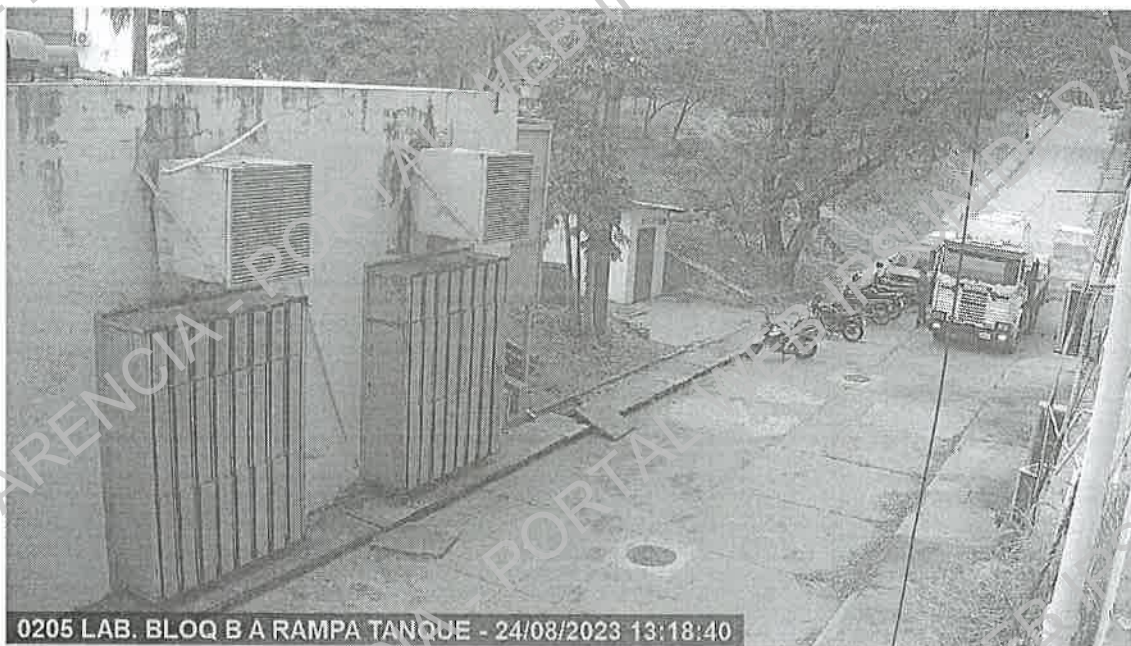
Imagen II: Descarga de equipos, en fecha 24/08/23 a las 13:19 hs.