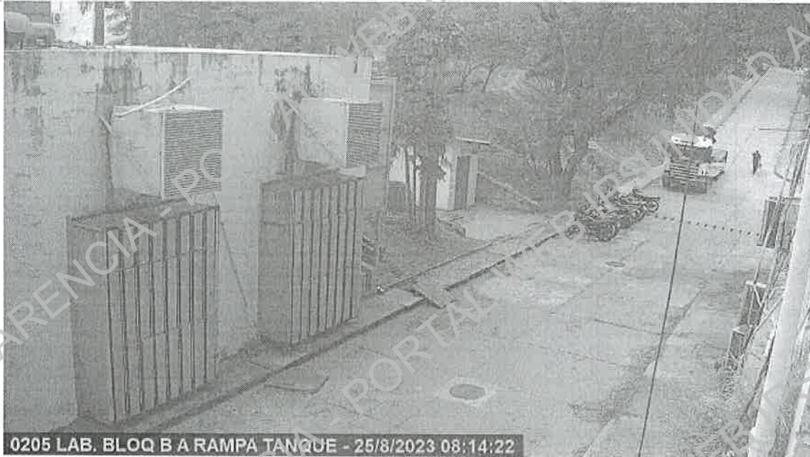
Imagen IV: Descarga de equipos, en fecha 25/08/23 a las 08:52 hs.

Imagen III: Ingreso del camión para las descargas de los equipos, en fecha 25/08/23 a las 08:14 hs.